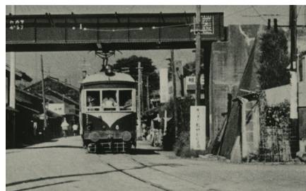
▲二俣線(現:天竜浜名湖線)