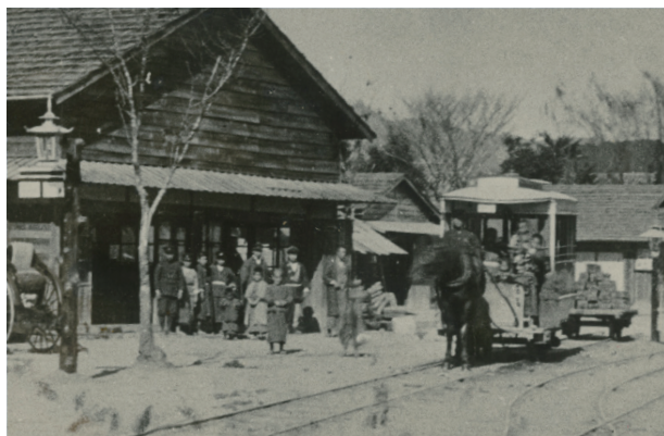
▲明治35年に誕生した馬車鉄道