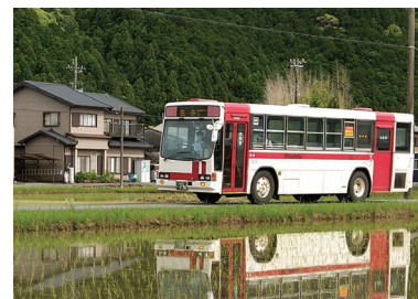
▲秋葉バスの路線バス

「静岡鉄道」より森町以北における乗合・代替バスの存続を目的にして「秋葉バスサービス株式会社」を設立し、同年10月に同区間(秋葉線)の営業を譲受して運行を開始