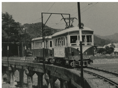
▲さようなら電車 (昭和37年)

1950年代以降、モータリゼーションにより乗客が減少したことから、鉄道は全線廃止され、同区間を「静岡鉄道」の乗合バスにより代替バスとして運行を開始